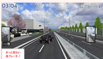
エコ&安全ドライブを実体験

エコカーの普及はここ数年で急速に伸びており、ハイブリッド車は毎年100万台ずつ、又、近年では電気自動車も急増しています。購入の時には積極的にエコカーを！