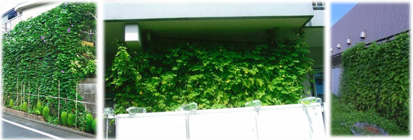
▲令和元年度(2019年度)入賞作品